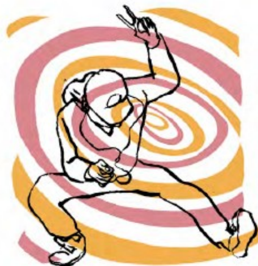
O escuchar un tipo de música especial