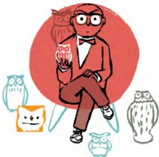
Hay personas que coleccionan objetos (cajas de cerillas, búhos, sellos, muñecas...)

Hay muchas personas que disfrutan HACIENDO ALGO “especial” que les gusta mucho y les hace sentirse contentos y relajados. Cuando lo hacen, no se dan cuenta de que el tiempo corre, y podrían pasar horas y horas haciéndolo.