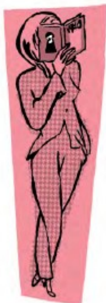
Hay personas a las que les encanta leer