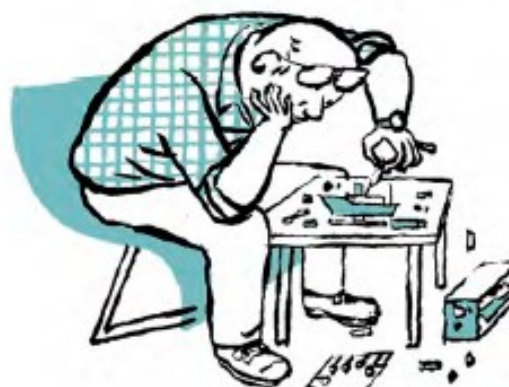
Otras hacen algún tipo de manualidad