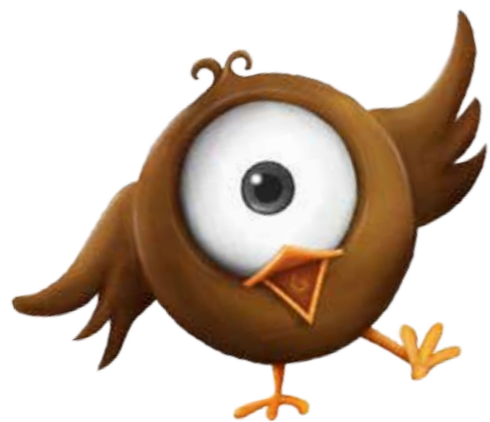
Serafín, el pájaro que buscaba su melodía

Disfruta de los otros cuentos de la colección y vive nuevas historias junto a: