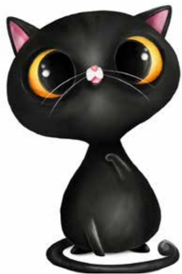
Gato Negro, el felino de la buena suerte