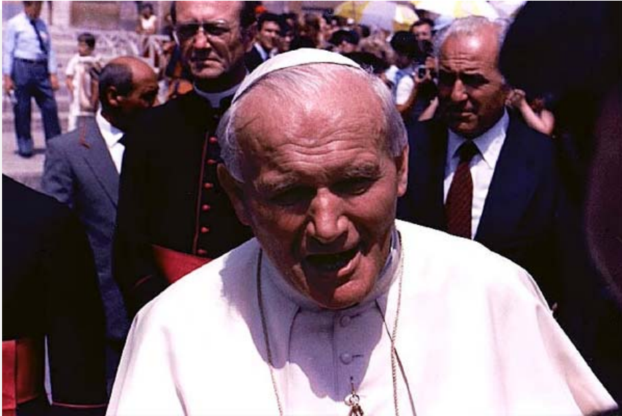
Karol Wojtyła o papa Xoán Paulo II.