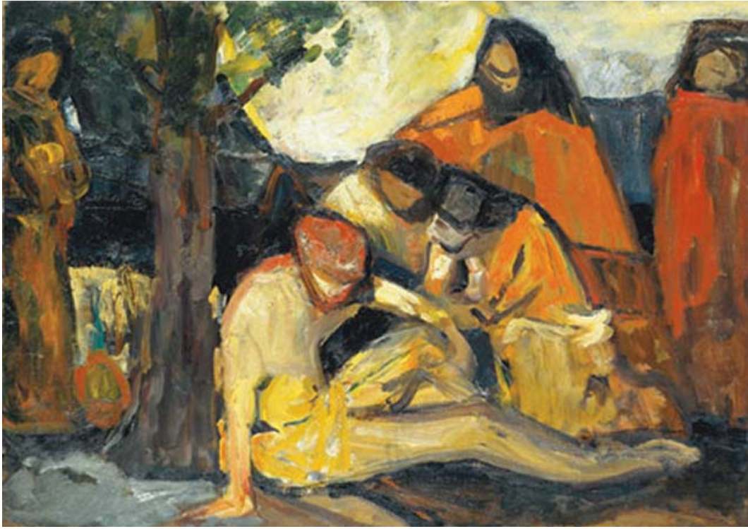
Adolf Hölzel, O bo Samaritano , 1909.