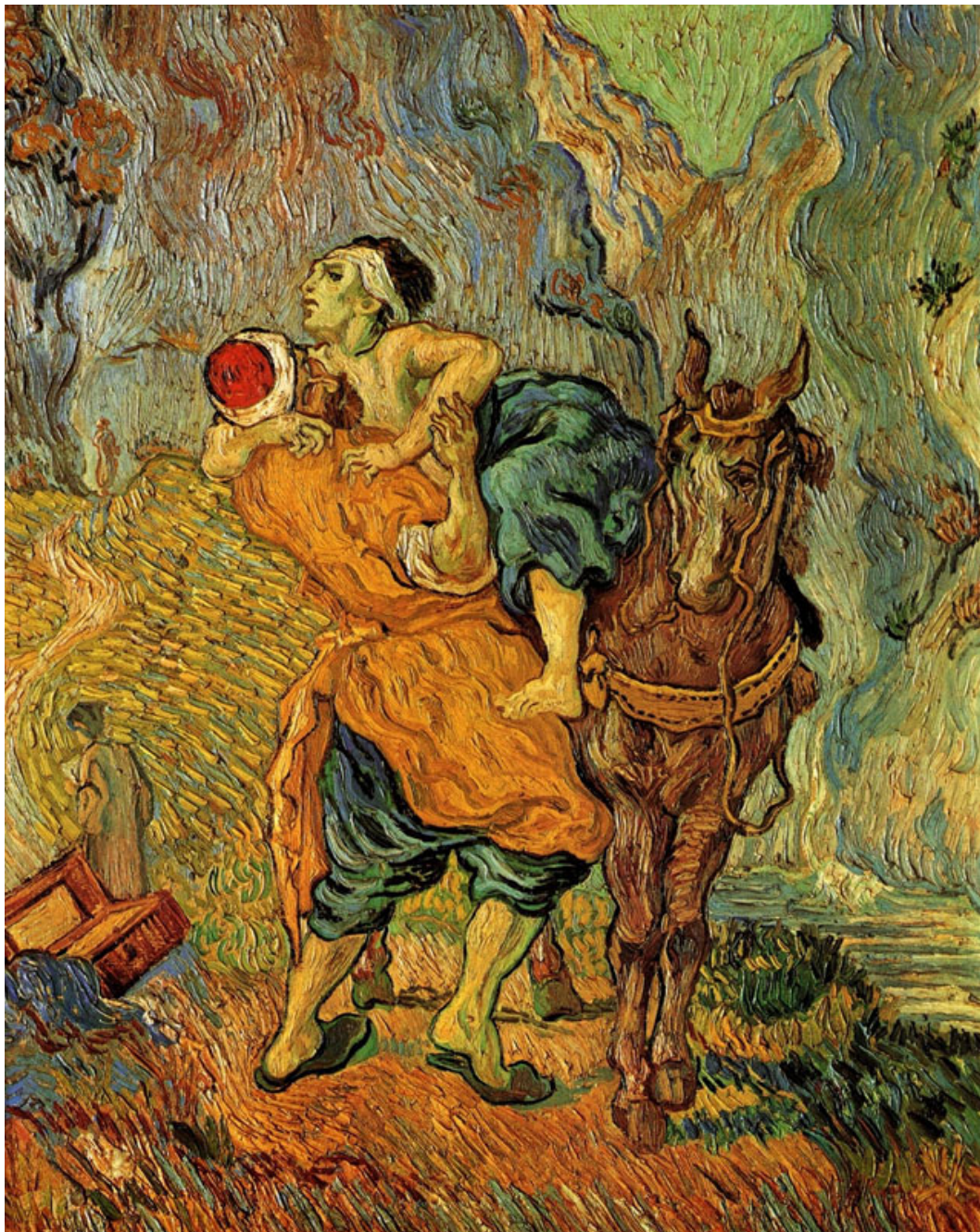
Vincent van Gogh, O bo samaritano , 1890.