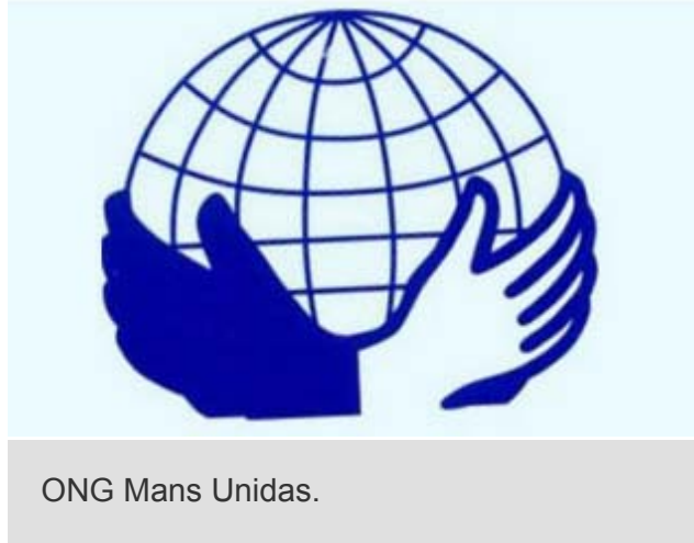
ONG Mans Unidas.

É unha organización para a axuda ao Terceiro Mundo. A súa acción oríentase á axuda ao desenvolvemento e está formada por voluntarios. A súa finalidade é a loita contra a fame, a deficiente nutrición, as enfermidades, a miseria e o subdesenvolvemento.