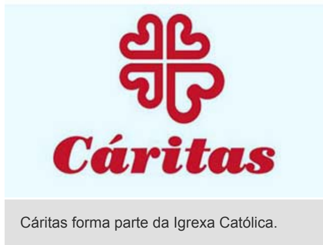
Cáritas forma parte da Igrexa Católica.

Cáritas ( https://www.caritas.es ), organización da Igrexa Católica para a acción caritativa e social.