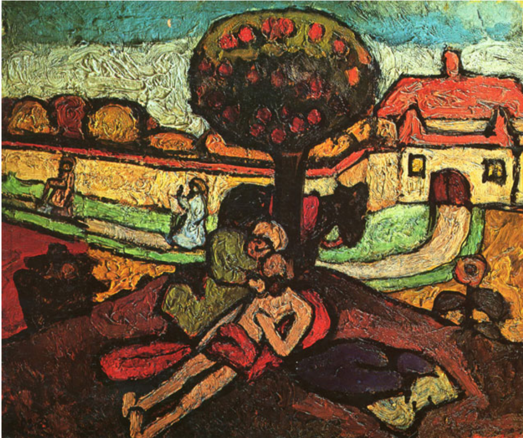
Paula Modersohn, O bo samaritano , 1898.