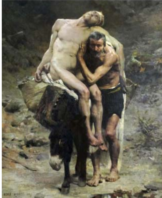
Aimé Morot, O bo samaritano , 1880.

Parábola do bo samaritano (Lucas 10, 25-37). Un mestre da lei preguntoulle a Xesús: “E quen é o próximo?” A o que Xesús lle contestou con esta parábola: “Un home viaxaba de Xerusalén a Xericó. Uns ladróns asaltárono, roubáronlle todo o que levaba, déronlle unha malleira deixándoo malferido. Por ese camiño pasou un sacerdote do templo e cando viu ao viaxeiro cambiou de camiño para non pasar por diante. O mesmo fixo un levita que pasou por alí, tamén pasou de longo sen prestar axuda.