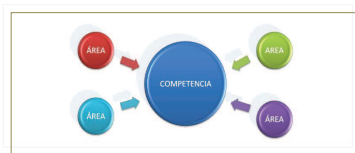
Tabla 3. Definición COMPARTIDA de las Competencias desde las áreas curriculares

diseñamos actividades y proponemos contenidos y objetivos, la selección que se realiza no sea intuitiva, sino que pueda ser realizada desde una matriz donde se dispone de toda la información relacional.