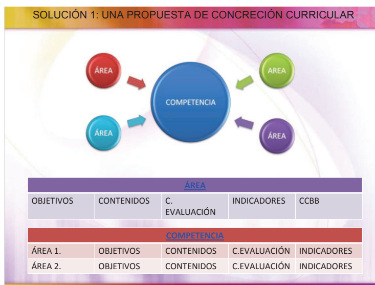
Tabla 9. Propuesta de concreción curricular

Una vez finalizado el proceso indicado podremos dotar cada competencia con los elementos curriculares de las distintas áreas o materias.