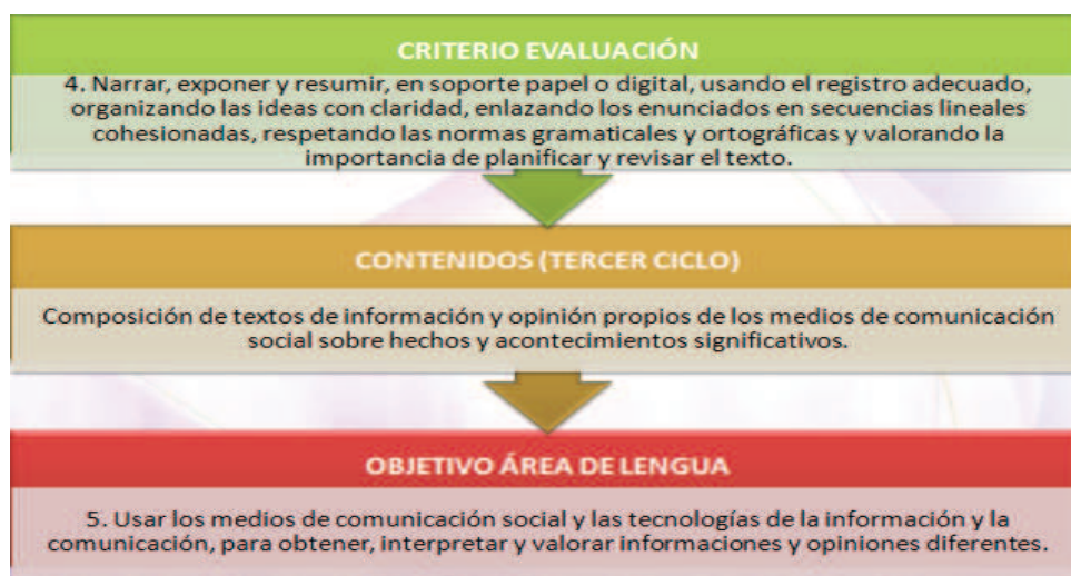
Tabla 5. Ejemplo de asociación de elementos curriculares del área de Lengua en el tercer ciclo de Educación Primaria

Para ello será necesario que en cada una de las áreas o materias se relacionen cada objetivo con los criterios de evaluación que indiquen el grado de adquisición de los aprendizajes expresados en estos, y que se identifiquen los contenidos necesarios para su adquisición. Pero, como se verá, para realizar el juego de relaciones tendremos que partir del criterio por ser el más prescriptivo y disponer de información global tanto del contenido como del objetivo o proceso cognitivo.