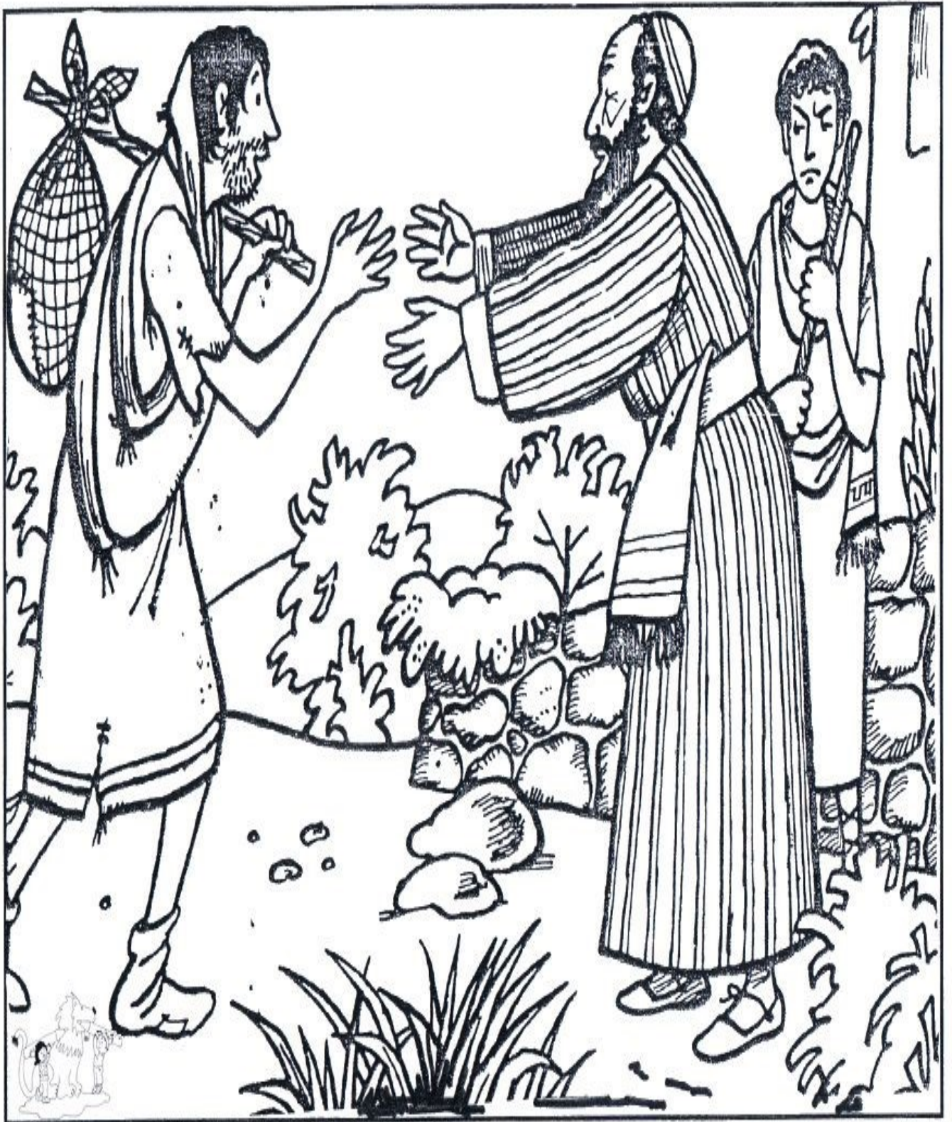
Debuxo " El hijo pródigo".