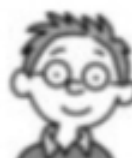
Xoa ♠ in