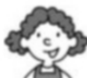
Mari ♣ a