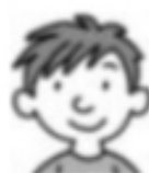
Henri ♠ e