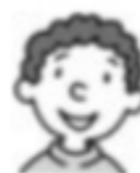
Ni ♣ olao