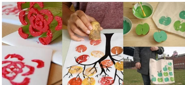
Técnica de estampación