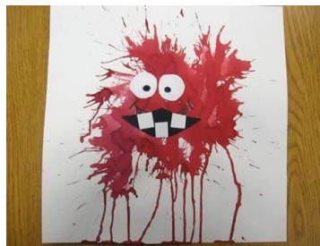
Técnica de soprado