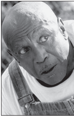
Cool Papa Bell

Los personajes se reconocen por sus palabras. A ver si adivinas quién dice cada una de estas frases.