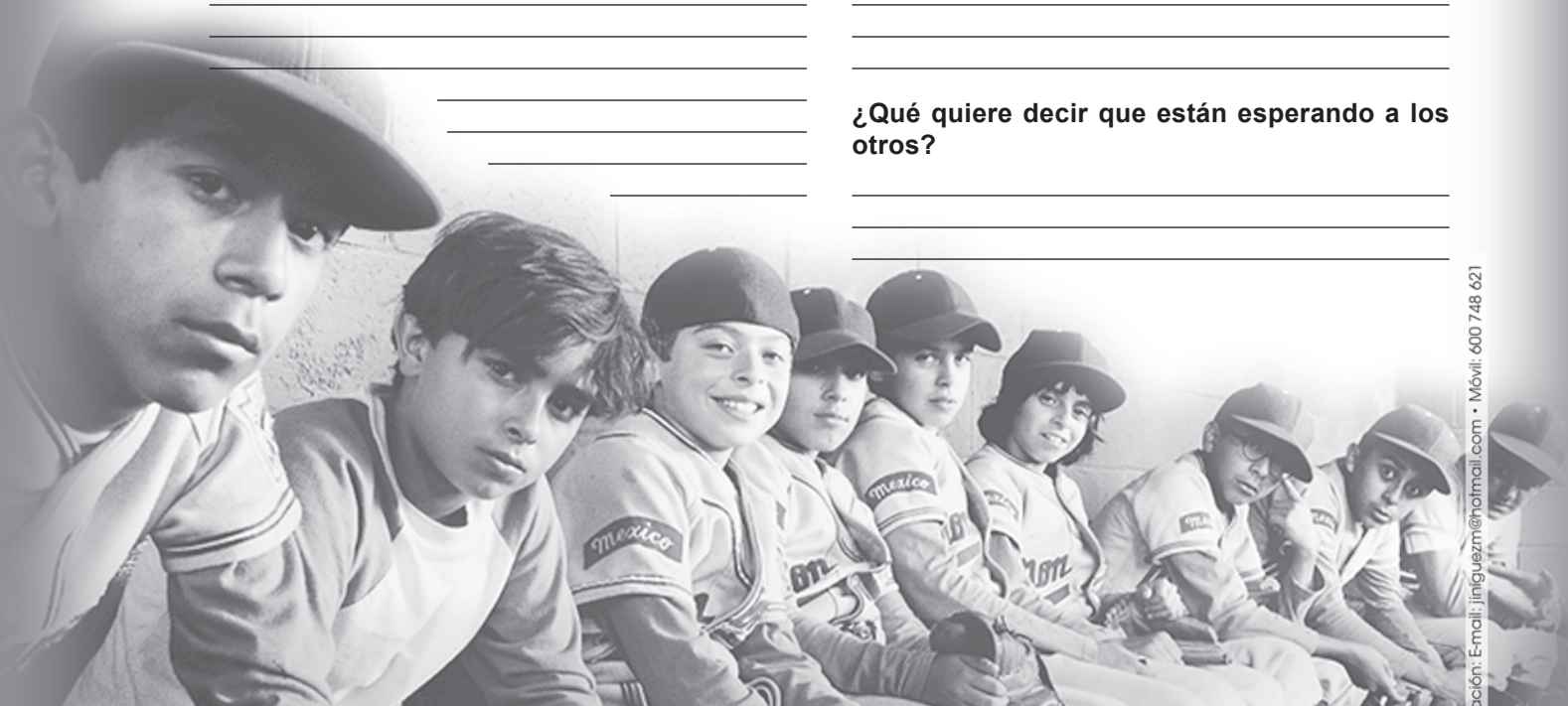
Guías elaboradas por Semana de Cine Espiritual.

¿Qué quiere decir que están esperando a los otros?