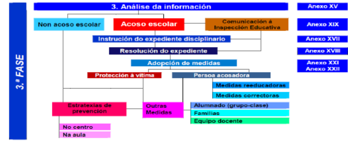
Cadro 3. Esquema da terceira fase do protocolo.