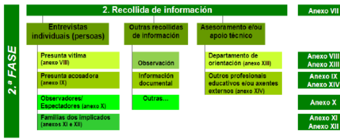
Cadro 2. Esquema da segunda fase do protocolo.

Unha vez rematado o proceso de recollida de información, rexistraranse nun documento todos os datos relevantes para proceder á súa análise.