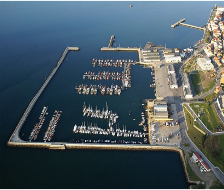
VIRXE DE GUADALUPE

Rianxo é un concello mariñeiro, podemos atopar varias parroquias que teñen peirao s nos que atracan os barcos.