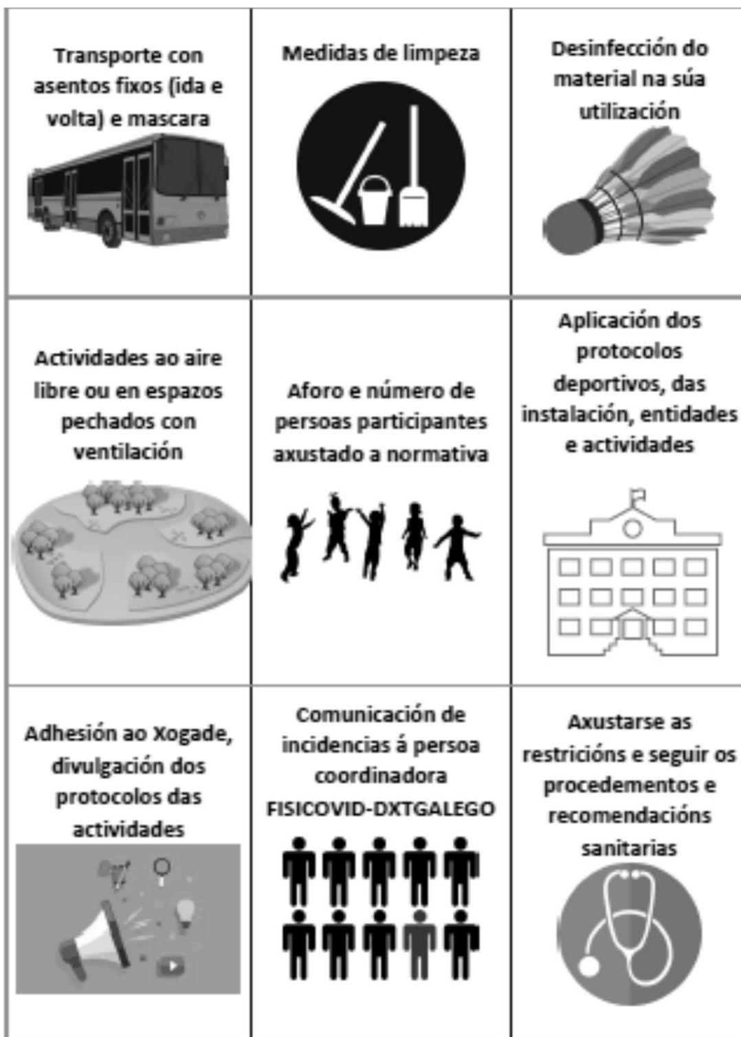
Figura 2. Resumo de medidas organizativas de adestramentos e/ou competición