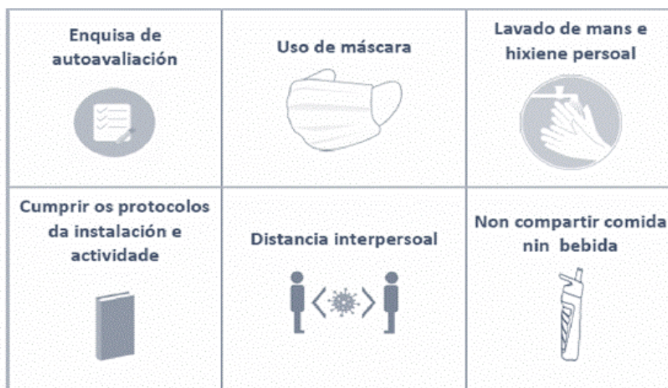
Figura 1. Resumo de medidas de protección individual