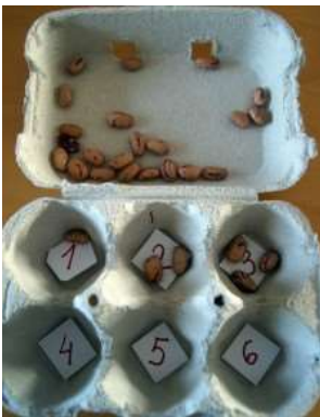
Agrupación por cantidade

- Cunha caixa de ovos hai unha chea de actividades por crear, mirade: