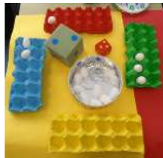
Sumas por cores

- Outro material que atopamos facilmente pola casa son pinzas da roupa (onde hai números se aínda non os identifican pódense poñer puntos, cruces...):