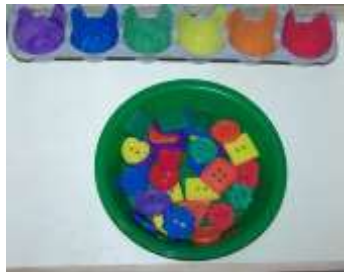
Clasificación por cores