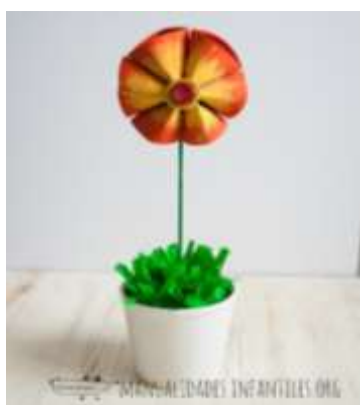
Flores con rolo de papel