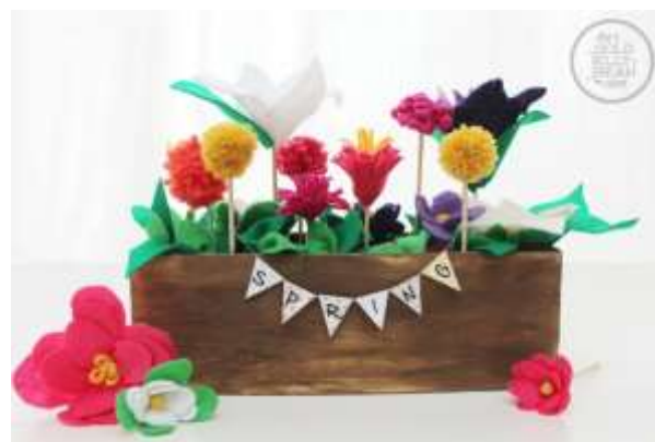
Maceta con feltro e lá

(pinchando na imaxe dirixe a un vídeo/web onde explica como facelo)