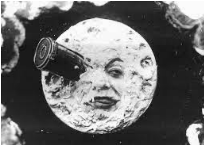
Da terra á Lúa