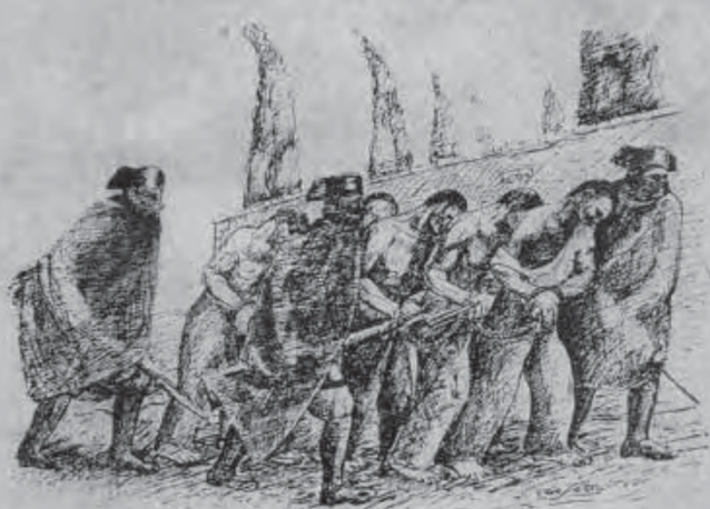
LA PROCESION DEL AMANECER