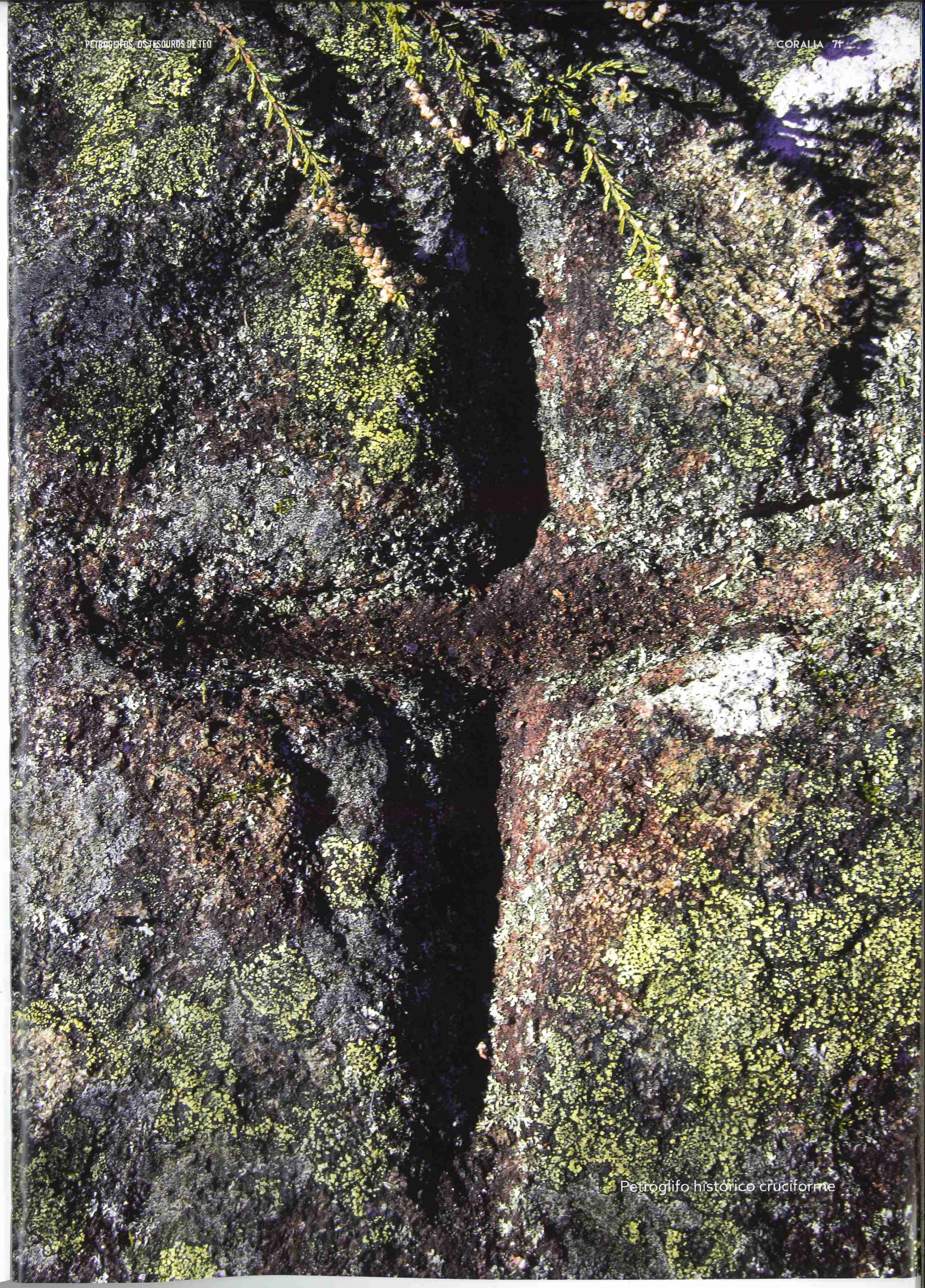
Petroglifo histórico cruciforme

Pronto haberá seis anos desde que o Colectivo A Rula, asociación cultural da comarca de Compostela que promove a protección e divulgación da arte rupestre, comezara a organizar itinerarios nocturnos no verán para ver os petróglifos de Teo. Grazas ao uso de focos, os visitantes poden contemplar motivos que, polo día, a causa do desgaste dos gravados, resultan máis difícil observar. Aproveitando esta experiencia previa, o Concello de Teo apostou polo acondicionamento e sinalización da ruta para facilitar o achegamento aos petróglifos, ao mesmo tempo que propoñen unha alternativa de lecer e ocio activo ao aire libre, e poñen en valor unha fermosa zona da comarca compostelá non tan coñecida como merece.