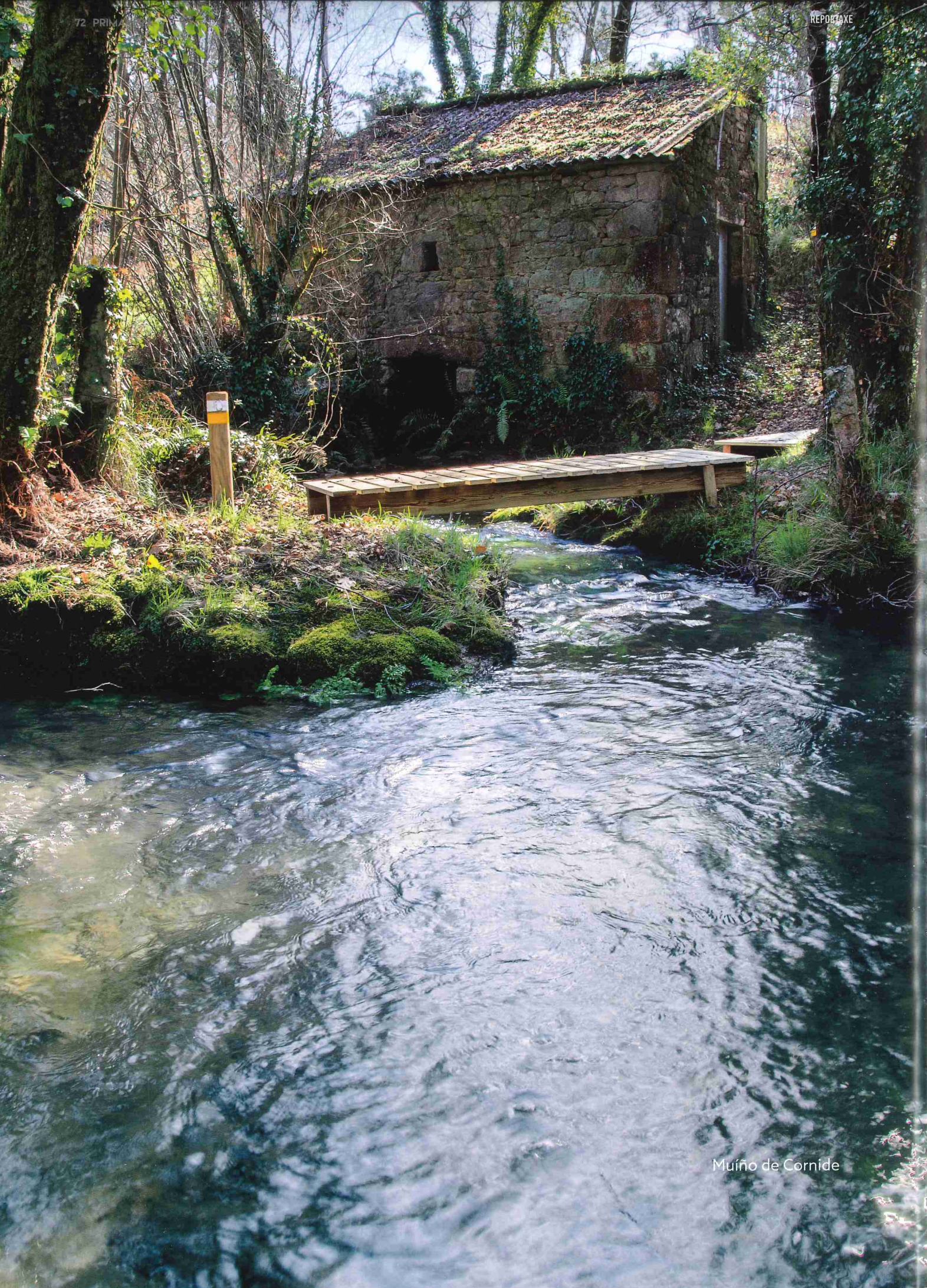
Muíño de Cornide