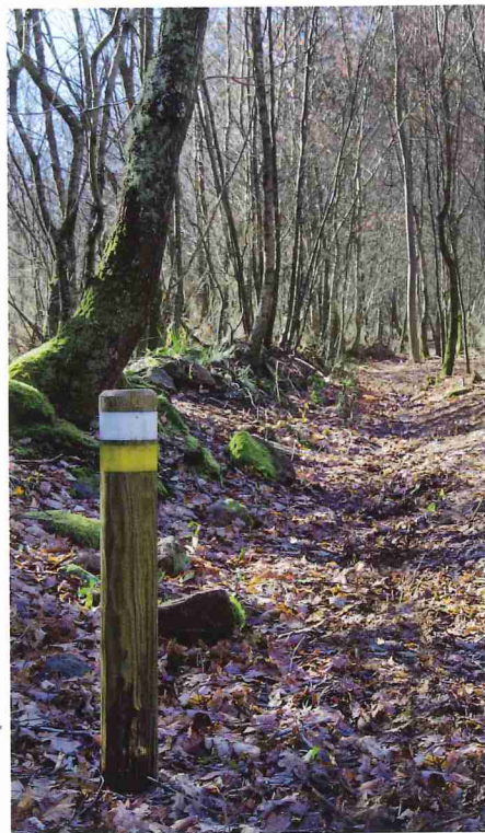
Carballeira de Cornide

O CONCELLO DE TEO APOSTOU POLO ACONDICIONAMENTO E SINALIZACIÓN DA RUTA PARA FACILITAR O ACHEGAMENTO AOS PETRÓGLIFOS, AO MESMO TEMPO QUE PROPOÑEN UNHA ALTERNATIVA DE LECER E OCIO ACTIVO AO AIRE LIBRE, E POÑEN EN VALOR UNHA FERMOUSA ZONA DA COMARCA COMPOSTELÁ NON TAN COÑECIDA COMO MERECE