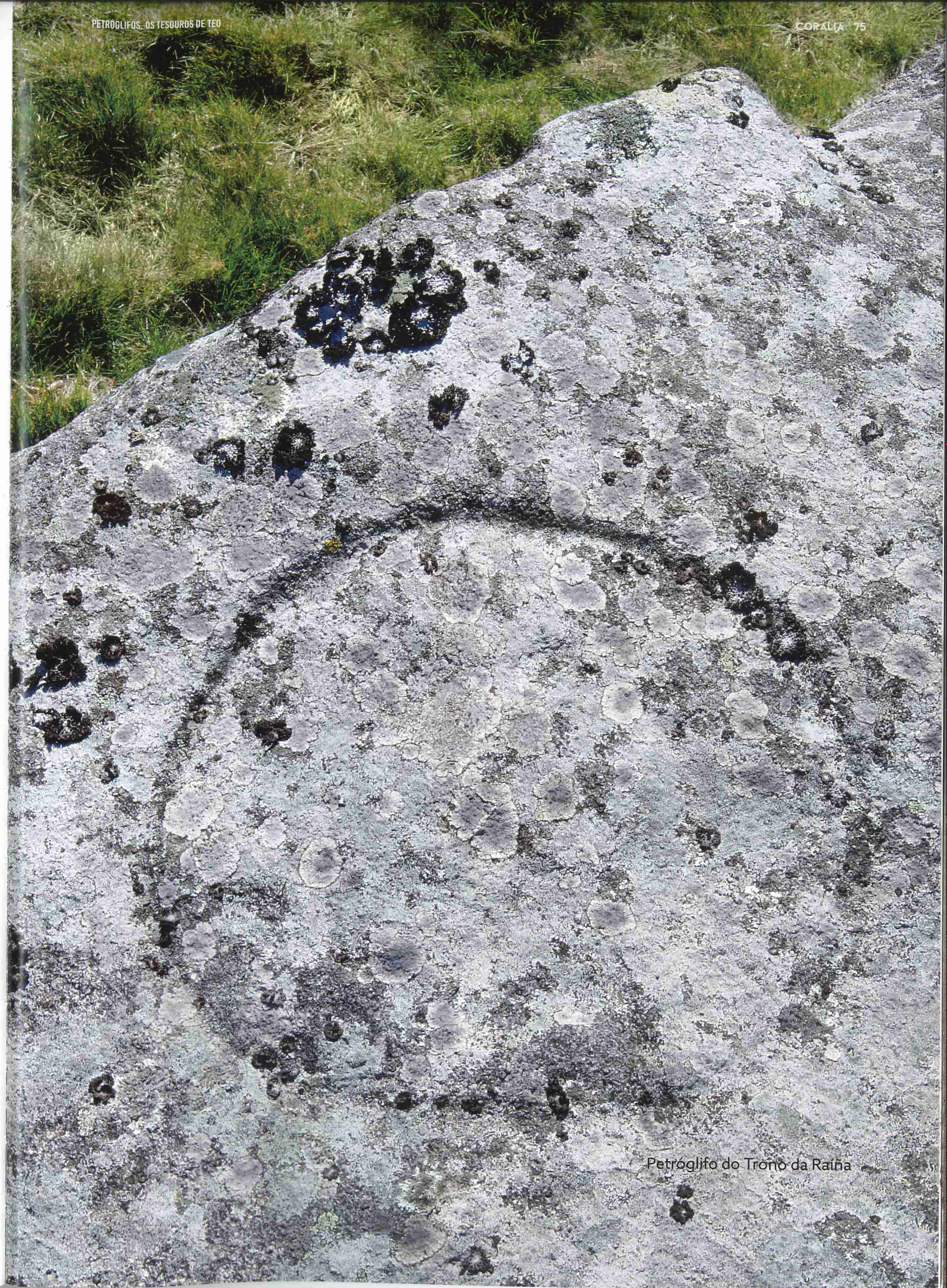
Petróglifo do Trono da Raíña

CHEGANDO XA AO PIQUIÑO O PERCORRIDO IMITA UN DOS GRAVADOS CIRCULA- RES DAS ROCHAS E REA- LIZA UNHA PEQUENA CIRCUNFERENCIA QUE OFRECE UNHAS INMELLO- RÁBEIS VISTAS PANORÁ- MICAS DAS TERRAS DO VAL DO ULLA. AO PISAR ESE TERREO ATOPARÉMO- NOS XA NA NECRÓPOLE MÁIS IMPORTANTE DE TODA A COMARCA