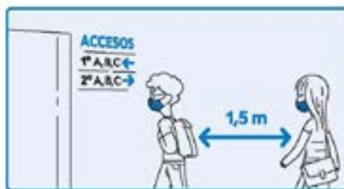
Acceder pola entrada e na quenda que me correspondan, mantendo a distancia.