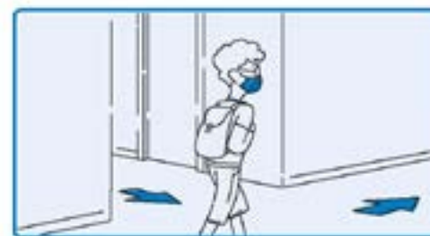
Circular en sentido único nos corredores atendendo a sinalización.