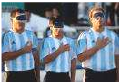
Al equipo argentino de fútbol para ciegos se lo llama: Los Murciélagos