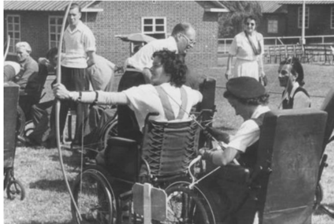
Competencia de atletas en silla de ruedas de 1948

Esto motiva a otros países en 1950, en Bavaria se realiza la Primera competencia de Esquí para inválidos de guerra. Alemania en 1951 funda su Asociación de atletas con discapacidad. En 1952, se unieron al movimiento los excombatientes holandeses y participaron en los Primeros Juegos Internacionales Stoke Mandeville, donde cada año, a excepción de los años olímpicos se celebrarían Juegos Internacionales y donde en 1981 se remodelaría y construiría el primer complejo deportivo totalmente accesible y reglamentario para atletas en silla de ruedas.