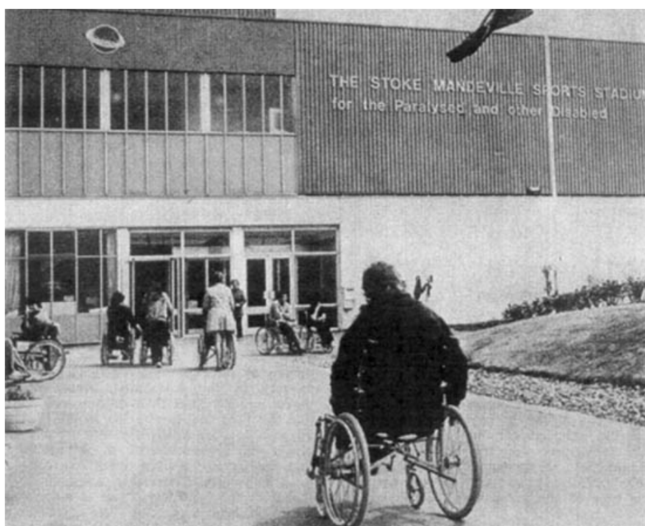
Primer estadio para múltiples discapacidades, inaugurado por la Reina Isabel en 1969