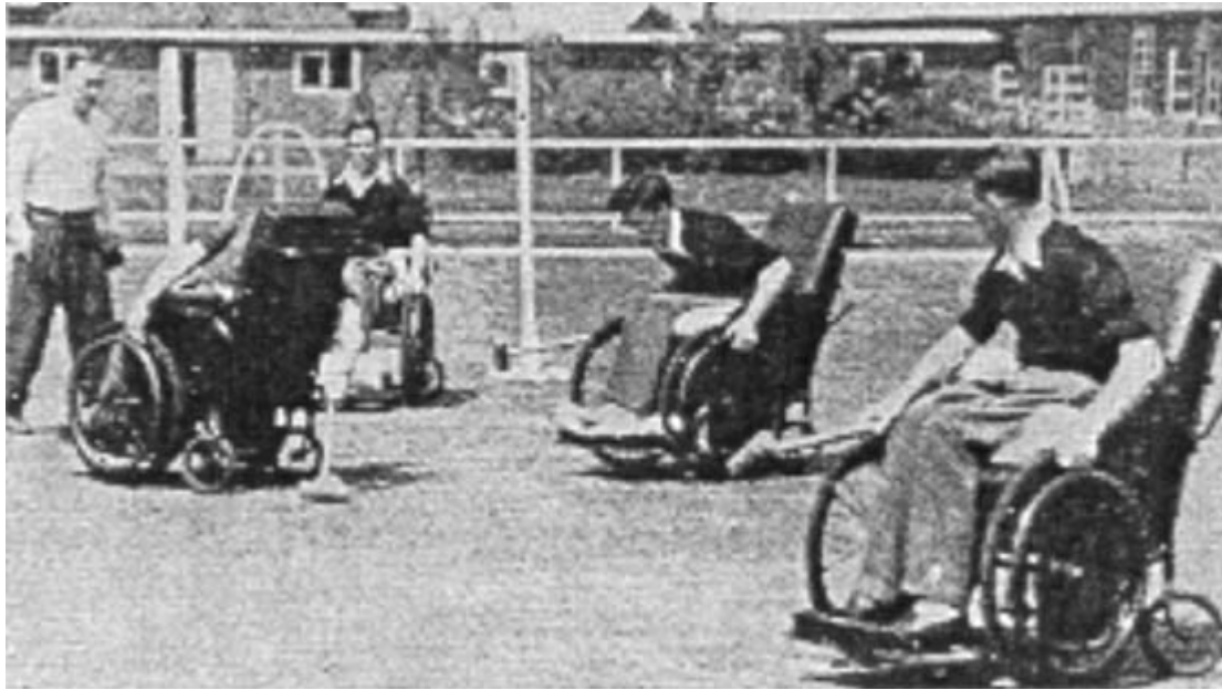
El Dr. Guttmann dirigiendo un partido de polo en sillas de ruedas

El básquetbol nace en Inglaterra, pero es en Estados Unidos donde adquiere más importancia con el equipo "Flying Wheels" de California, este equipo realiza una gira por los Estados Unidos y en la trayectoria, los ciudadanos que habían visto estos juegos quedaron asombrados; esta gira dejaría un doble resultado: aumenta el interés y el apoyo por los deportes en silla de ruedas y lo más importante fue que las personas que presenciaron el espectáculo comprendieron que si los individuos en silla de ruedas podían practicar el básquetbol con habilidad, destreza, coordinación e ímpetu, también podrían, bajo un buen entrenamiento, desempeñar correctamente también, un empleo.