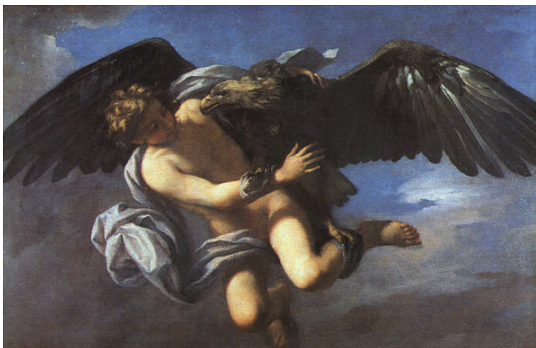
Rapto de Ganimedes por Domenico Gabbiani, 1700. Dominio público.

Os roles e estereotipos de xénero, dos que xa falamos na unidade 3, tamén afectan á sexualidade de homes e mulleres.