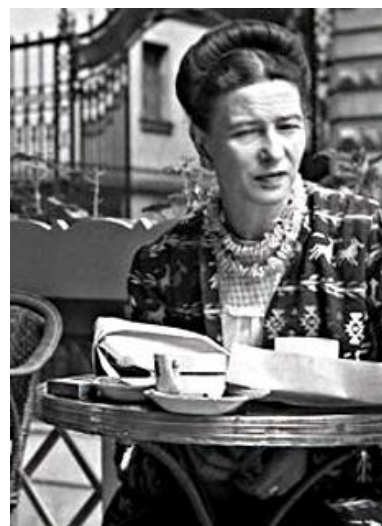
Simone de Beauvoir no Café de Flore, París, 1950.

O xénero pola contra non vén determinado ao nacer, senón que é unha construción social. É dicir, é un conxunto de ideas creadas pola sociedade sobre un ou outro sexo. Como xa