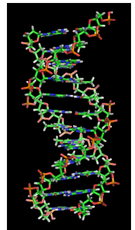
Cadea de ADN, por Richard Wheeler. Licenza CC-BY-SA 3.0

Este proceso despreza as contribucións das mulleres ao logros da sociedade ou directamente atribúeos a homes. No eido da ciencia un dos