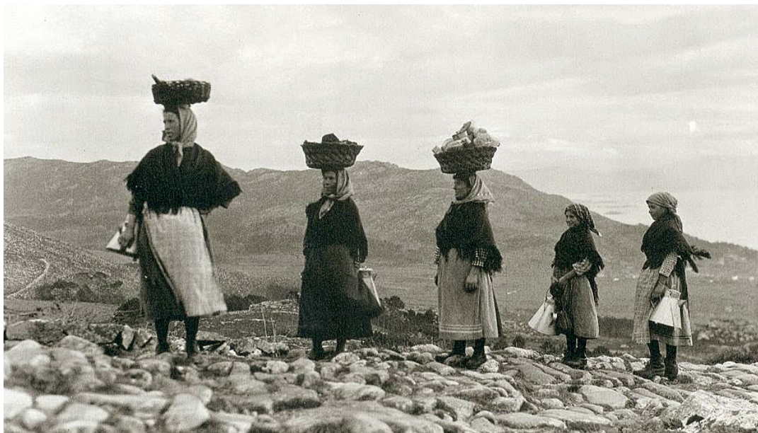
Leiteiras de Carnota de regreso de Muros, fotografadas en 1924 por Ruth M. Anderson. Fonte: GCiencia

esforzo físico , son fundamentais para o sostemento da familia. Ao tempo, como estes traballos adoitan cargarse sobre as nenas, afástanas da escola.