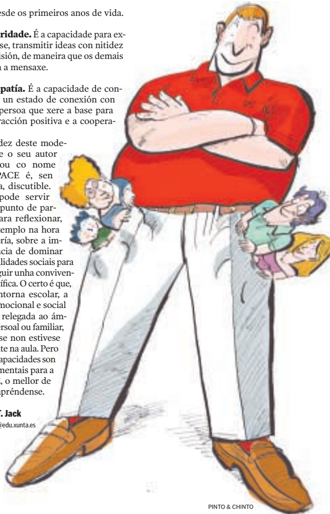
PINTO & CHINTO