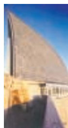
Vista exterior da Domus

■ Fai torres con cada tipo de merengue. ¿Con cal se consegue unha torre máis alta? ¿Cal mantén mellor a súa forma?