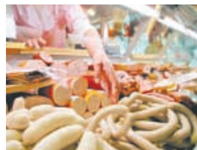
Nunha salchicha pódese experimentar o procedemento da momificación, que foi utilizado no antigo Exipto

Se deixases á salchicha exposta ao aire, sen bicarbonato sódico, transformárase en algo amofado e cun espantoso cheiro. Isto é o que sucede coa comida que non se garda na neveira: estrágase porque as bacterias e os fungos encárganse de transformala en algo podreído e amofado. As bacterias e os fungos necesitan auga para vivir. E o bicarbonato sódico encargouse de sacar a auga á salchicha. Sen auga non hai putrefacción.