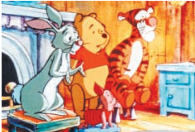
En «A película de Tigger» pódense ver as aventuras de Winnie the Pooh e mais os seus amigos

Antes deste filme, que se ofrecerá o 10 de marzo, proxectáronse xa na sede da Fundación Caixa Galicia as cintas Piratas , historia de aventuras mariñas que supuxo un xiro radical na filmografía do realizador Roman Polanski, e Os Goonies , na que Richard Donner dirixe un relato de Steven Spielberg convertido en éxito nos anos oitenta e xa todo un clásico do cine de aventuras. Proximamente, ofreceranse outras cinco historias: O segredo da Pirámide , o día 24 deste mes, daranos a oportunidade de ver en acción a un