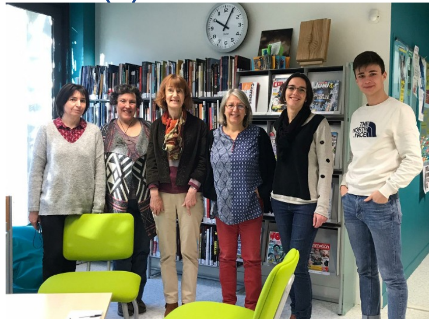
Lycée Enseignement General, Vendôme (Francia)