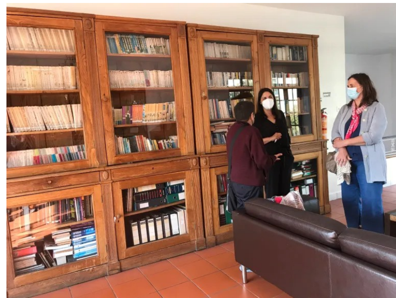
Univ.Sénior Eugénio de Andrade, Porto