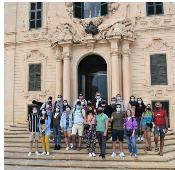
Agency for the Welfare of the Asylum Seekers, Malta