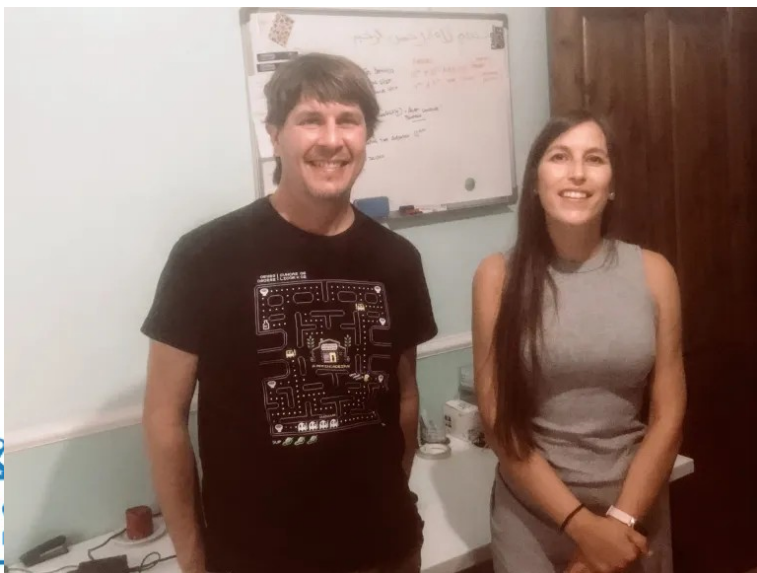
Mama me voy, Malta