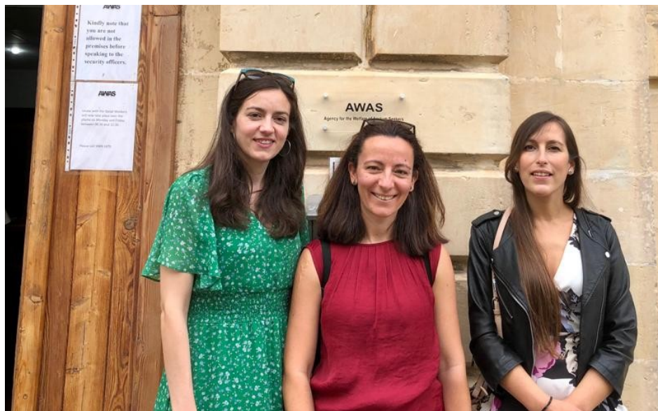
Agency for the Welfare of the Asylum Seekers, Malta