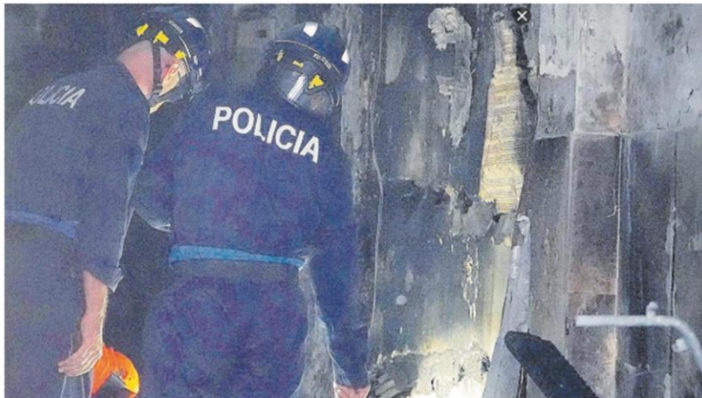
Dos policías, en el portal donde estaba el cuadro eléctrico donde se originó el incendio.

D urante las primeras horas del incendio que el 11 de octubre se cobró la vida de una madre y de tres de sus hijos en un edificio de viviendas de la ciudad de Madrid, la Policía Nacional ya vio como empezaba a despuntar la hipótesis contraria, la de un fuego fortuito. La exhaustiva investigación posterior confirmó el pálpito de los agentes: efectivamente no había sido intencionado , sino que el origen estaba en el cuadro eléctrico del portal de ese edificio okupado de la calle Alfonso X el Sabio, una instalación que de hecho era una verdadera bomba de relojería por los enganches ilegales al que lo sometían los residentes. Concluidas las pesquisas policiales y con esta