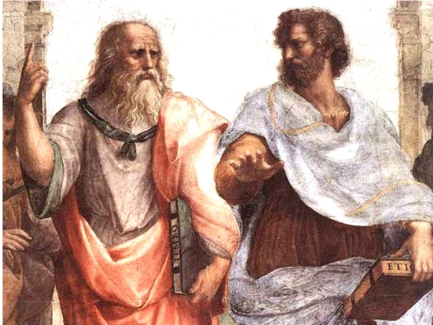
Inagen de “La academia de Atenas” de Rafael. Platón lleva en su mano el Timeo y Aristóteles la Ética. Platón apunta al cielo, quizá a lo inteligible...

Lo cierto es que, frente a la orientación especulativa y abstracta de la Academia, el Liceo se parece mucho más a una Universidad moderna dedicada a la investigación científica. Aristóteles había reunido en torno a él un amplio círculo de investigadores, científicos, historiadores y filósofos. Los discípulos, bajo su dirección, estaban dedicados por completo a recopilar datos y observaciones sobre los más diversos asuntos. Hicieron una recopilación de 158 constituciones de ciudades griegas, Teofrasto se encargó de escribir una historia de la filosofía ...pero lo que verdaderamente destacó en esta época fueron los estudios sobre historia natural y biología, donde aparte de algunos errores evidentes, aparecen observaciones y descripciones difícilmente superables. Aristóteles escribió más sobre biología y botánica que sobre filosofía. Todas las observaciones estaban guiadas por un principio: «Se debe dar más crédito a la observación que a las teorías»