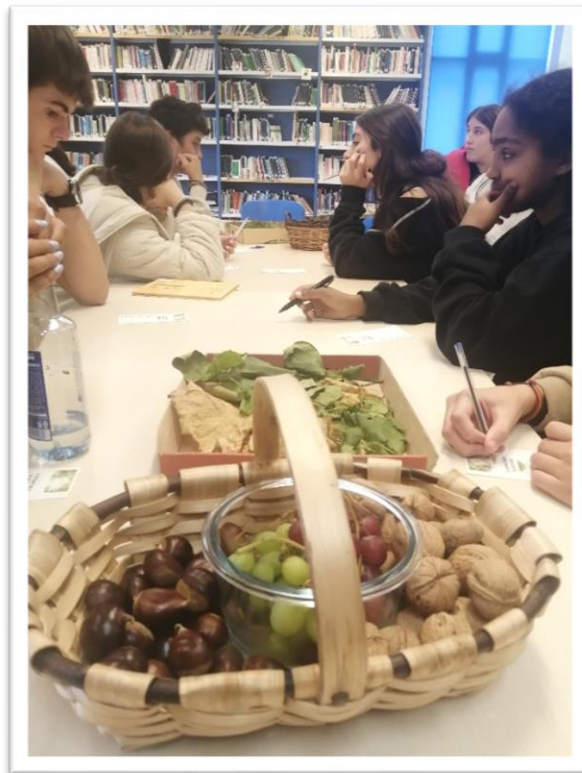
“O home que prantaba árboles”, 4º ESO, 18 outubro