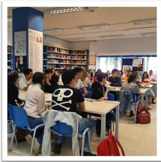
“Os vellos non deben de namorarse”, 2ºBAC, 11 outubro