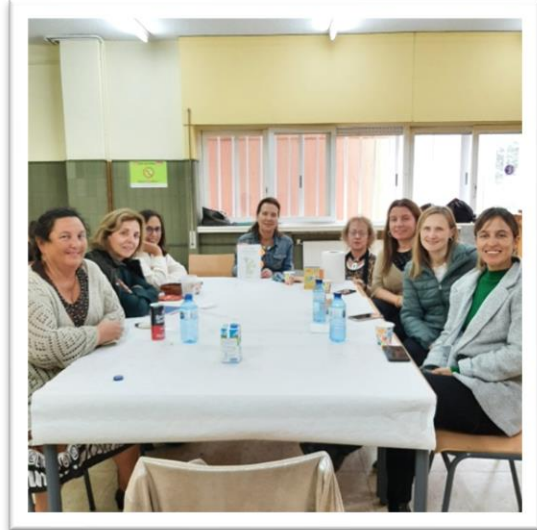
“El infinito en un junco”, adultos, 13 de outubro