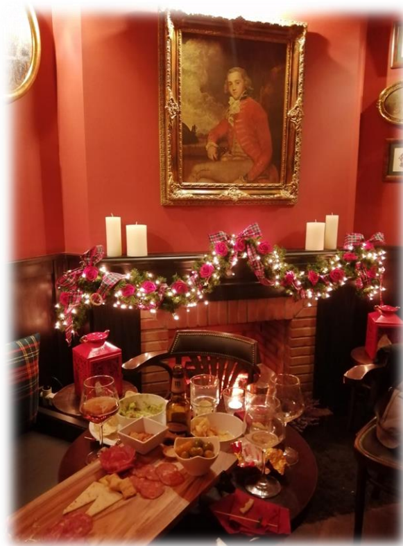
“Godville”, adultos, 13 decembro