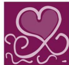
Certame Cartas de Amor