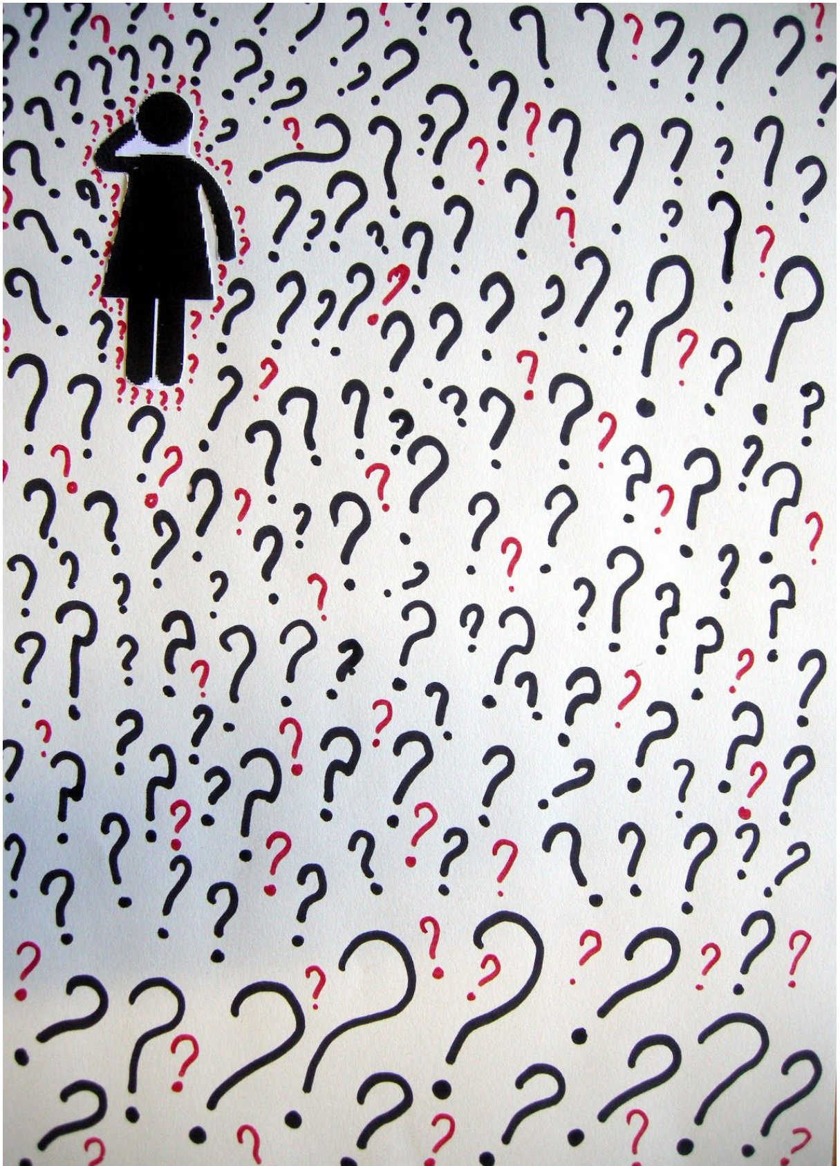
Debuxo de Raúl Salgueiro, 4º ESO