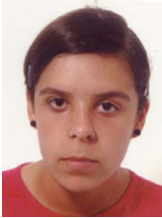
Rebeca Villapol Baltar