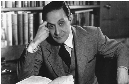
Enrique Jardiel Poncela

Tras el fin de la Guerra civil, el teatro se vio afectado, más que los demás géneros si cabe, por la nueva situación política. A ello hay que añadir que la censura del régimen franquista era particularmente dura con los escritores teatrales, que sufrieron la prohibición de representar cualquier obra que pudiera ser interpretada como un ataque a los gobernantes.