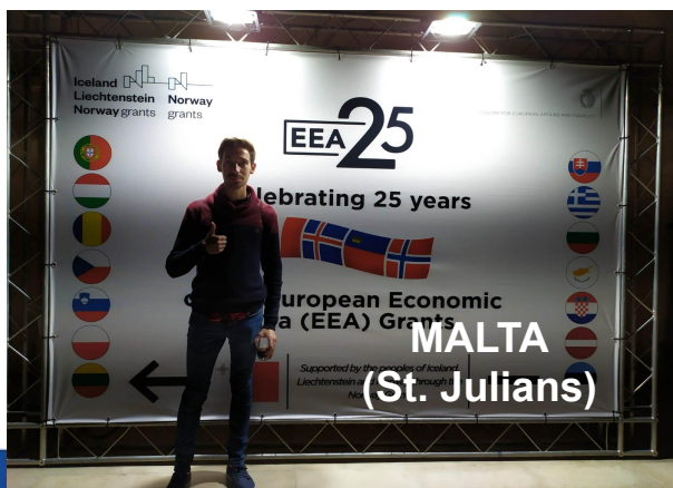
MALTA (St. Julians)