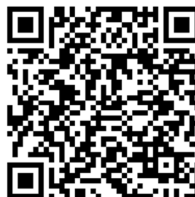
Ilustración 1: QR Acceso a trámite de solicitudes

Co fin de optimizar os desprazamentos e as citas programadas cada xornada, buscarase combinar os centros e aulas de modo que se poidan atender cos recursos dispoñibles, e ao mesmo tempo, tratarase de adaptalas as preferencias da escola ou instituto solicitante, na medida posible. Calquera modificación será acordada co centro escolar.