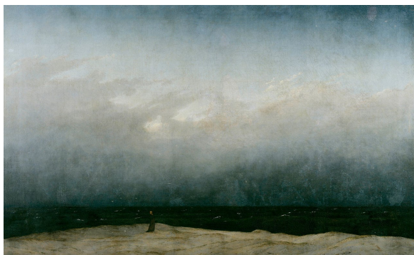
DER MÖNCH AM MEER. 1810: Friedrich, Caspar David. Nationalgalerie, Staatliche Museen zu Berlin

O protagonista experimenta unha crise espiritual. Terá necesidade o ser humano crer nun ente superior? O relato inspírase no cadro homónimo de pintor romántico alemán Caspar D. Friedrich.