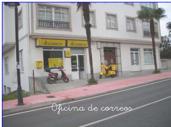
Oficina de correos