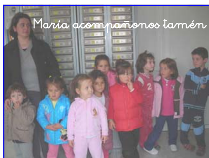
María acompañanos tamén