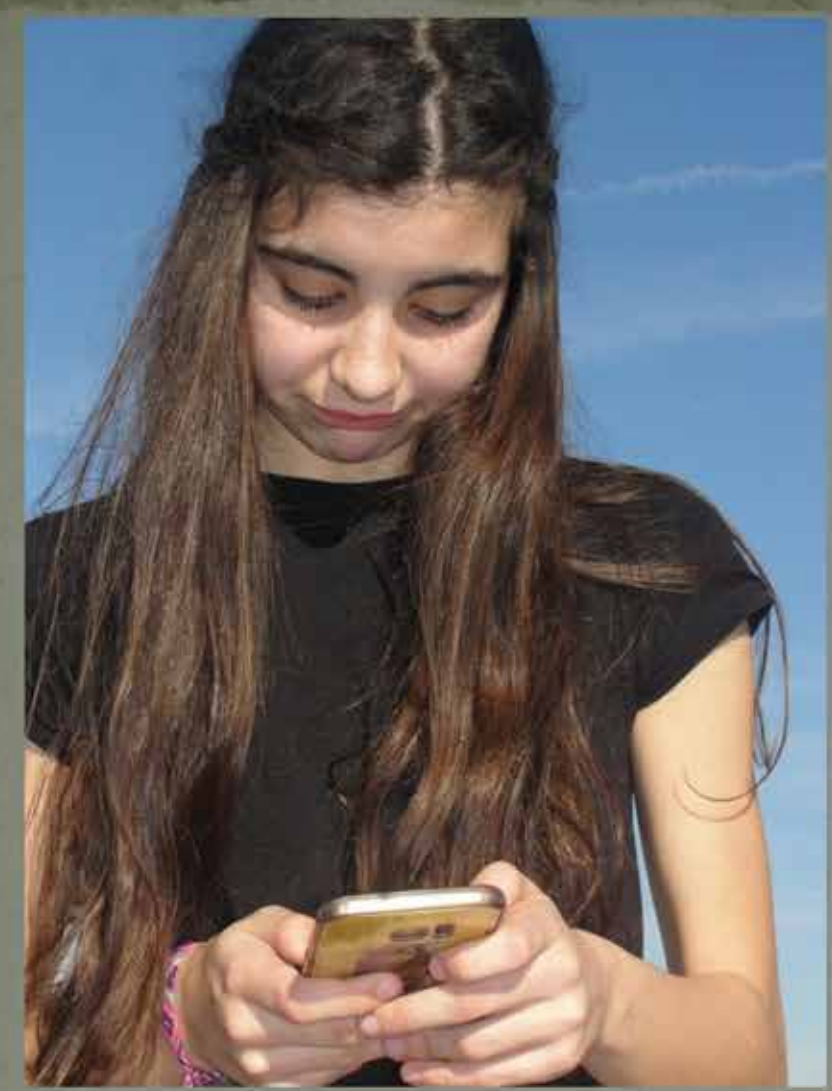
EL DINERO DA LA FELICIDAD??