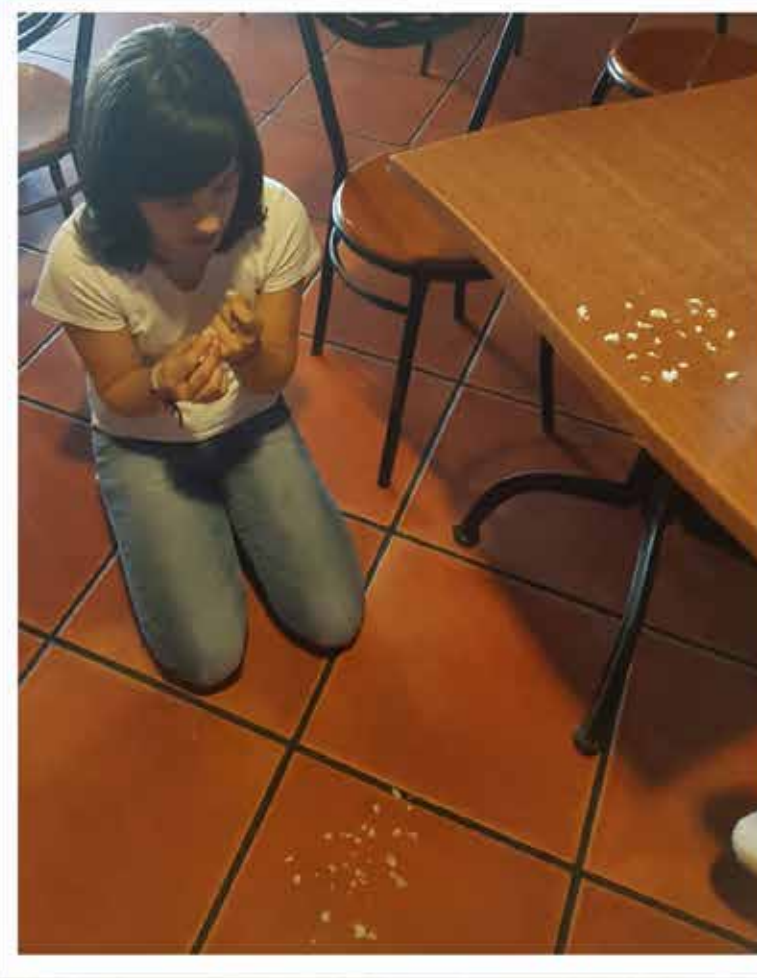
NUESTRA CLASE SOCIAL??