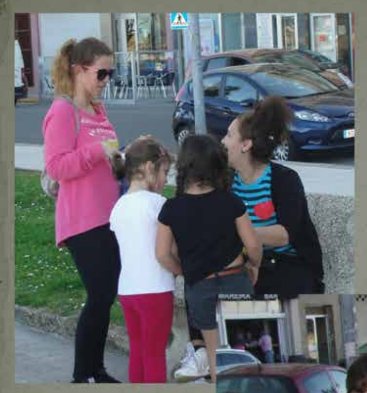
ES ESTA LA SOCIEDAD QUE QUEREMOS??