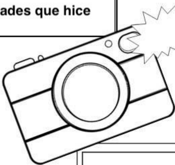
Lo que más me gustó