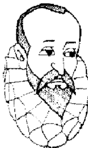
MIGUEL DE CERVANTES