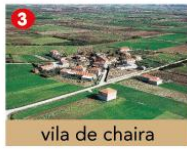
vila de chaira

2 No verán, moitos dos seus habitantes traballan no turismo, dándolles servizo aos visitantes que buscan gozar do sol e do mar.