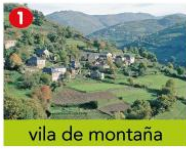
vila de montaña