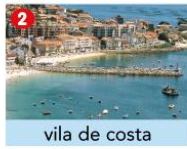
vila de costa