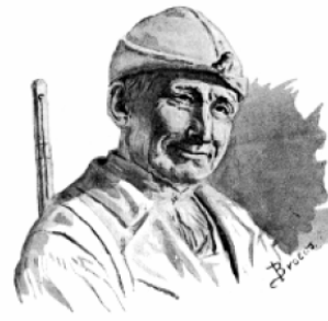
Un gomeiro galego de 1808.