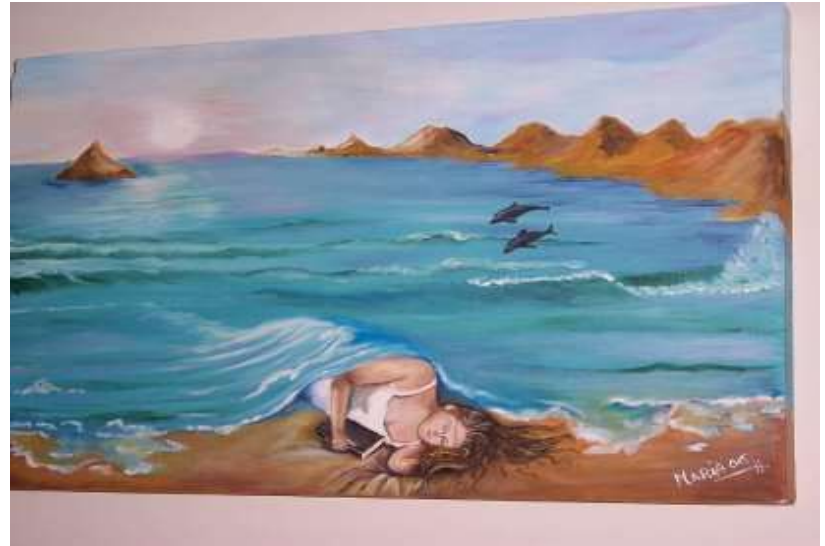
A filla de Msalamanca pediulle unha escena da beira do mar para a súa habitación, e o resultado foi este apacible cadro con influencias surrealistas de Dalí. Toda a visión parece flotar no maravilloso umbral dos soños.