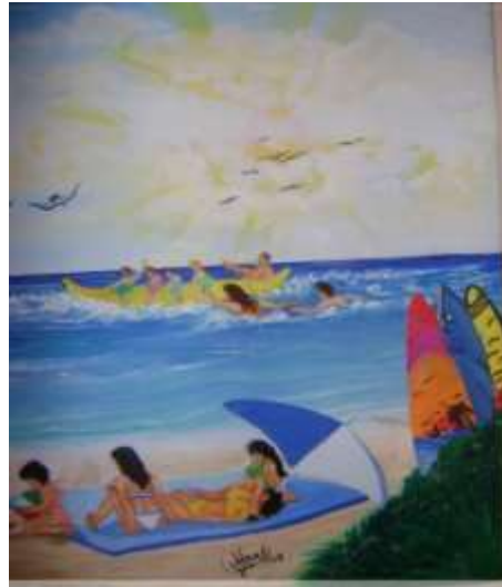
Un día de verán na praia dende outra perspectiva - Jaime Orlando Cajamarca EEUU

Para todos aquellos que siguen siendo niños aunque los adultos les obliguen a disimularlo