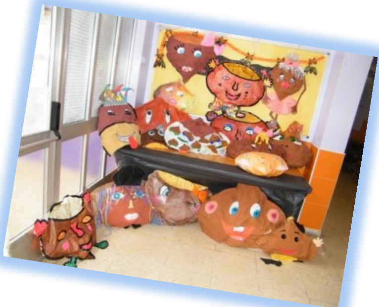
Exposición de Castañas