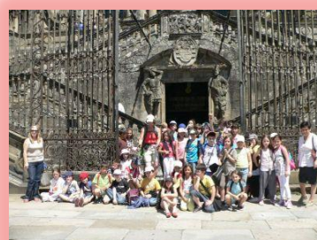
Visita á Catedral de Santiago