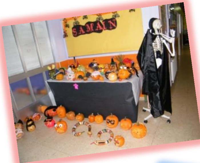
Exposición de Cabazas