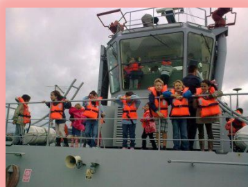
Bautismo de Mar pola Ría de Ferrol