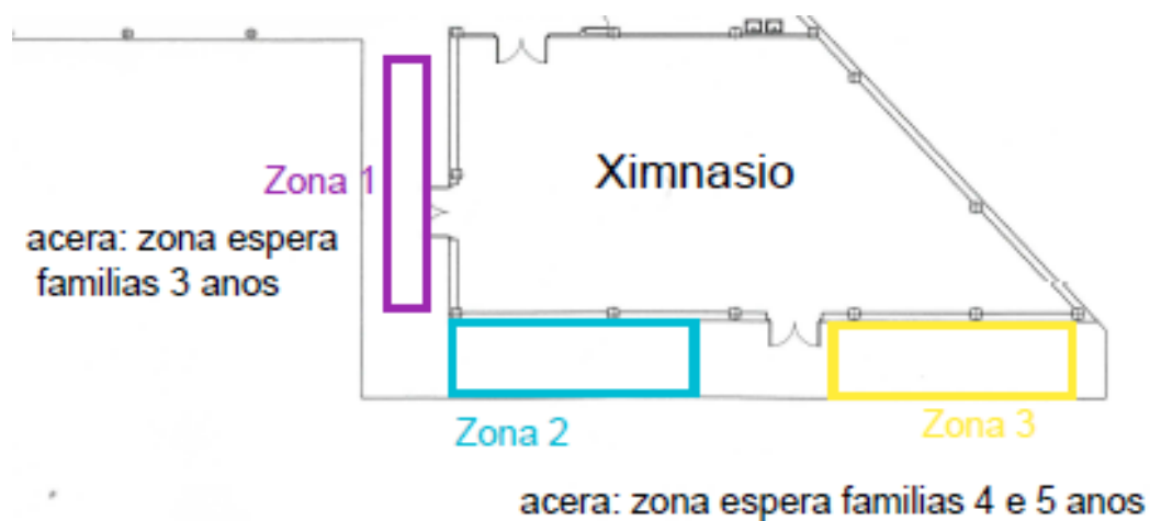
Plano das zonas de saída de educación infantil