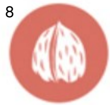
FROITOS DE CASCA