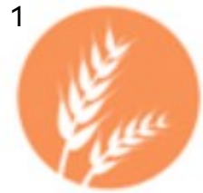
CEREAIS CON GLUTE