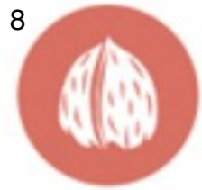
FROITOS DE CASCA