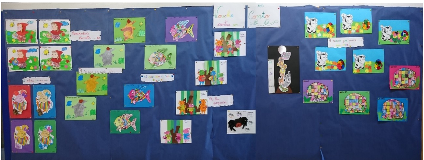
Mural elaborado coas portadas dos diferentes contos traballados

Os nenos e nenas de 3 anos estiveron a traballar con contos. Algúns foron contos de sempre como Carapuchiña vermella ou Os tres porquiños , e outros mais contemporáneos, como A vaca que puxo un ovo e O peixe arcodavella . Sen dúbida o que mais gustou foi A toupiña que quería saber quen lle fixera aquilo na cabeza... Foi moi divertido facer a caca de plastilina para poñela na portada!, védelo?