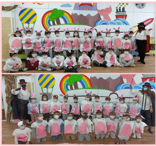
Alumnado de 6º E.I posa co seu disfraz

Os nosos alumnos disfrutaron dunha xornada festiva protagonizada pola maxia e o bo humor.