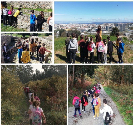
Alumnos de 1º de Ceip Alborada recorrendo o Castro de Elviña e os seus arredores.

Ademais fomos unha segunda vez, cunha visita guiada por dentro do castro. Alí, puidemos ver arqueólogos escavando, e nos ensinaron unha bala antiga da Batalla de Elviña e unha moeda romana! Tamén aprendemos moitas cousas, como que as preciosas vistas á Coruña e ao mar eran para vixiar aos inimigos que entraban nos seus barcos e que ademais tiñan unha gran muralla ao redor para protexerse. Encantounos estas visitas e pasámolo xenial!