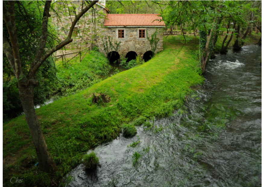
Área natural Muíño do Pedroso

O xoves, 27 de maio pola mañá sairán en autobús cara Narón. Unha vez alí comezan as actividades e os que quedan a durmir, instalanse en tendas de campaña, en grupos de 3 ou 4 e garantizando todas as medidas COVID. Lembra que rematan un capítulo moi importante nas súas vidas e que comezarán outro novo: O instituto. Agardamos que o pasen xenial nesta viaxe !!