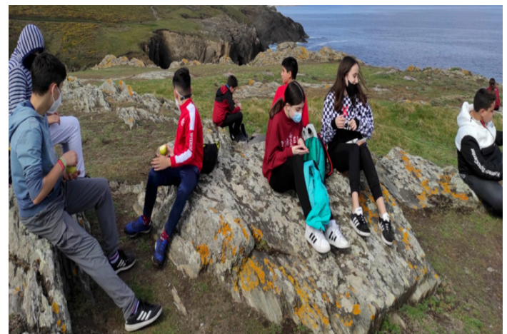
O alumnado merendando e disfrutando do entorno da costa de Dexo

Tomamos a merenda nunhas rochas preto das furnas mentres intentabamos ver os cormoráns e o paiño do mal tempo. Chamado así pola crenza mariñeira de que aparecían antes dunha tormenta.