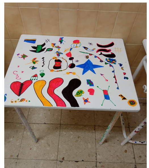
Decoración dunha mesa inspirada no artista catalán Joan Miró

Estas obras artísticas ocupan agora os corredores converténdoo nunha sorte de galería de arte ou nun pequeno museo cheo de creacións tan orixinais como interesantes.