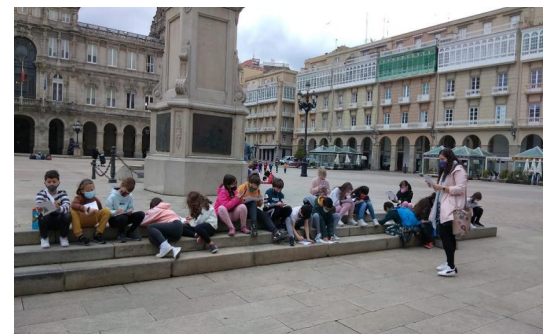
Alumnos de 3ºB investigan sobre Mª Pita aos pes da súa estatua.

Os alumnos de 3ºB do CEIP Alborada realizan unha ruta urbana no entorno de Mª Pita acompañados por unha guía que orienta e informa en todos os momentos do percorrido. Realízanse unha serie de actividades onde os alumnos participan e divírtense investigando sobre a vida, a persoa de Mª Pita e a súa actuación na defensa da cidade contra o ataque dos ingleses.