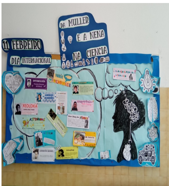
Mural feito o 11 de febreiro polo día internacional da muller e a nena na ciencia

Durante a semana da ciencia, ademais, os nenos e nenas de 5º e 6º de primaria fixemos un mural no que investigamos sobre mulleres que abdicaron a súa vida a diferentes ramas da ciencia como a arqueoloxía, a robótica, a entomoloxía, ... O día da muller e a nena na ciencia celébrase a causa do porcentaxe tan pequeno de mulleres que traballan nun oficio relacionado coa ciencia, sen embargo, o porcentaxe das mulleres no mundo é maior co dos homes.