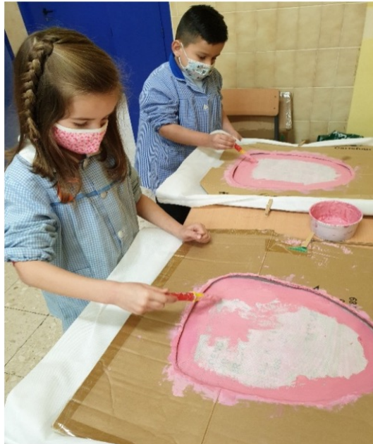
Alumnado de 6º de Educación Infantil elaborando o seu disfraz

Neste ano singular as meigas, trolls, nomos, fadas...non puideron celebrar o tradicional paseo polas rúas do noso barrio. No seu lugar o desfile realizouse no patio do colexio e a cercanía das familias trocou polos aplausos e vítores dos nosos compañeiros e mestres. O bo tempo nos acompañou e a música e o baile non podían faltar nunha festividade onde por unhas horas o poder da maxia converteu os nosos sonos en realidade.