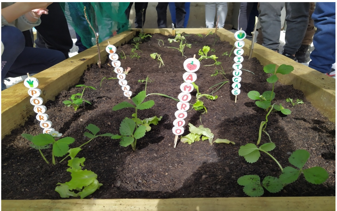
Mostra das verduras e froitas do horto: amorodo, cebolas, leitugas e porros.